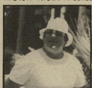
אוהד סימיקו המלך! המאסטר!

את הפוטנציאל של הקשרים, או קשה לחזור לימק"א, למיגרש שהוא החצי מבלומפילד. לוא בית-ר ירושלים היו