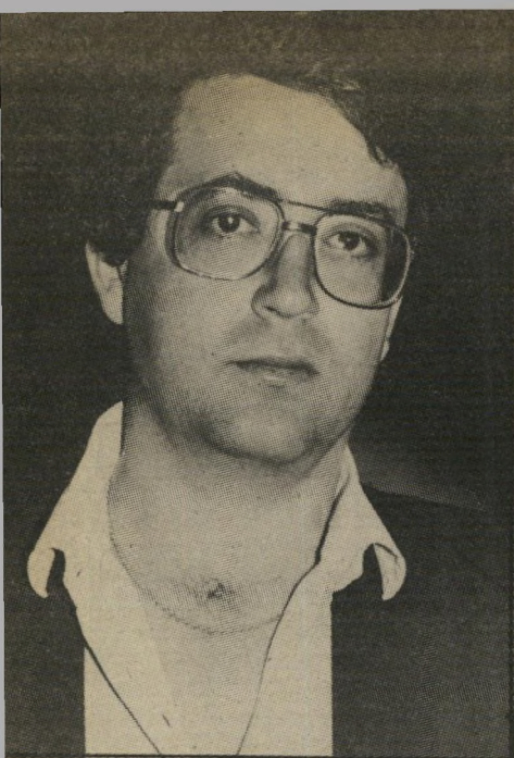
כתב ברזילי איי־שם

שוטרים. הם יצאו מן הרכב וכאו אל אנשי הטלוויזיה. אחד מהם פנה אל הכתב וביקש שאנשי־הצוות יתלוו אליהם לתחנת המישטרה.