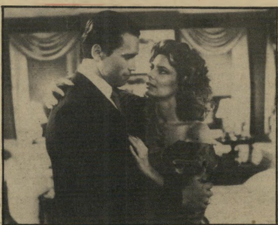
שווארצנגר והרולד: עבודה קלה

מה שאפשר לומר הוא, שיש סכנה ממשית בסרט כזה, המצדיק באורח הפגנתי שוטר המשתמש באלימות מיותרת, משום שהוא משוכנע כי זכותו להיות גם דיין וגם תליין באותה העת, אשר לאמינות של הסיפור: האם יש מישהו המוכן להאמין כי שווארצנגר יכול להתחפש למשהו אחר מלבד שווארצנגר, בצורה משכנעת?