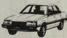
סובארו 1.3, 1.6, 1.8