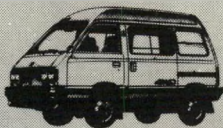
סובארו מסחרי (VAN)