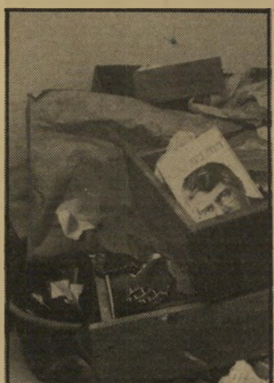
ספר לוי בין החפצים. אני לא רוצה לדבר על דויד...

על כל האיוור. למה לא הרסו את הבתים סביב הבית שלנו? ורוקא הבית הזה הפריע? במשך שנים התנהל עלי-כך משא-ומתן. בהתחלה הוחלט על דירה תמורת דירה, אבל הפסיקו לטפל בזה, כי הבית שייך, בעצם, לערבים. קוראים לכך "ניכסי נפקדים". לפני שנתיים התחילו לטפל בזה מחדש. יאשרו לאבא 32 אלף דולר כדמי-פינוי. או אישרו גם 6000 דולר כדמי פינוי לבית-הכנסת. בסוף שילמו 3500 דולר ופינו אותנו. ב-32 אלף דולר אפשר למצוא בית? העסק נמשך והלך. לפני חודש וחצי הגיעו לפתע-פיתאום טרקטורים והתחילו לעבוד ליד הבית שלנו. שאלנו: "מה קורה כאן?" אמרו: "סוללים כביש!"