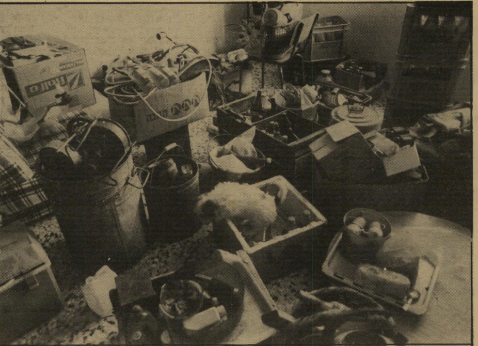
החפצים הורוקים של מישפחת סירוס. החדוניה של האחיות צריכה להתגלגל בין ההריסות?

על כל האיוור. למה לא הרסו את הבתים סביב הבית שלנו? ורוקא הבית הזה הפריע? במשך שנים התנהל עלי-כך משא-ומתן. בהתחלה הוחלט על דירה תמורת דירה, אבל הפסיקו לטפל בזה, כי הבית שייך, בעצם, לערבים. קוראים לכך "ניכסי נפקדים". לפני שנתיים התחילו לטפל בזה מחדש. יאשרו לאבא 32 אלף דולר כדמי-פינוי. או אישרו גם 6000 דולר כדמי פינוי לבית-הכנסת. בסוף שילמו 3500 דולר ופינו אותנו. ב-32 אלף דולר אפשר למצוא בית? העסק נמשך והלך. לפני חודש וחצי הגיעו לפתע-פיתאום טרקטורים והתחילו לעבוד ליד הבית שלנו. שאלנו: "מה קורה כאן?" אמרו: "סוללים כביש!"