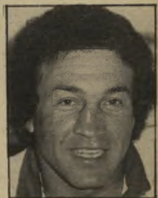
מאמן רוזן מי שמשריין נקודות

בשבת זה יהיה אימון טוב להפועל לוד. אני מתכוון להכניס שניים-שלו