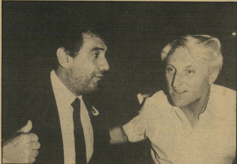
זמר דומינגו עם ציין גם בעברית

בקשתו של פיננברג לא היתה ברורה לכתבים, וגם לא לוותה בהסבר. לכן גם לא כיבדו אותה, וכל הפרטים על התוכנית הכלכלית החדשה פורסמו כבר אחרי חודשות השעה 5 אחרי-צהריים, ביומן הכלכלה של קול-ישראל.