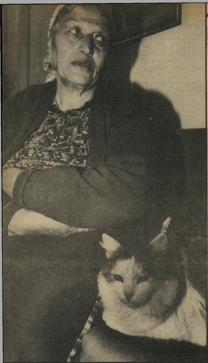
לאביבה הניה בביתה מדוע לא ישלחו אותו לכלא?

הסיום: אבראחם מצא את מותו לפני שניגש מישוהו להעבירו לבית החולים. איש אחד התקדם לעברו וכיסה את גופתו. בומן שהאחרים היו מחכים לאמבולנס.