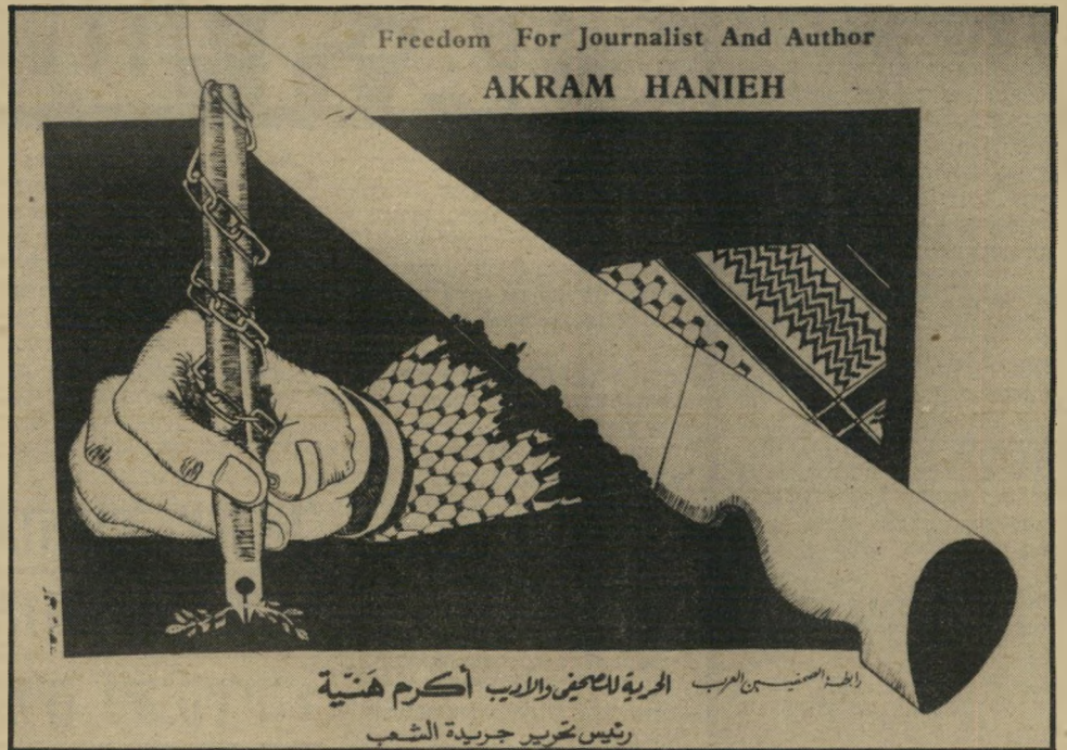
ברזה בגדה: "חרות לעיתונאי ולסופר" כדי לא לחשוף מודיעים

ל אות מהאח החליט שמואל הס' פרי למחוק כל קשר בינו לבין ה' חילוני האחרון, מחזה שלו. הסיבה: הצנוורה תלשה כמה קטעים מההצגה. על-כך כבר נכתבו גבעות של מילים, על אכזריותה של הצנוורה ועל חופשי התרבות ועל הדמוקרטיה.