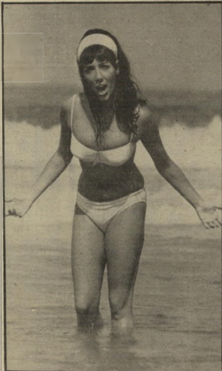
בת 23: סצצה בשפת-הים