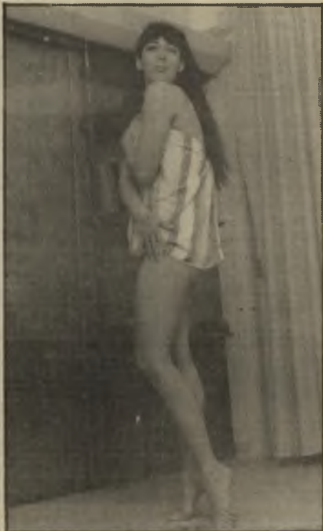
בת 24: ביקור בארץ