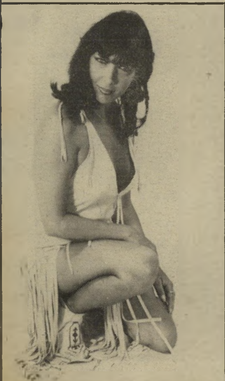
בת 25: דוגמנית