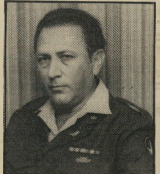
מנהל בן-דוב (1972) מודח

הראות רווח בכל מחיר, יש פיתוי מתמיד להקריב את הכל על מיזבח זה. למשל, לוותר על השקעות היוניות הדרושות לעתיד המיפעל, ולבדד שבי ספרים יופיע רווח מידי. אמר אחר המנהלים: "אין מדרים להערכה. מלבד המאזן". מנהל אחר: "מברכים על השקעה. אבל נזופים אם אין רווח כעבור שלושה חודשים". מסכם הסקר: "הרגש על ריווחיות קיצרנית טווח גורם להרבה מנהלים לפחד מלקיחת סיכונים". ושוב, אחר המנהלים: "התוצאה היא, שרוב המנהלים הם אדמיניסטרטורים וטכנוקראטים. כי שייקה לא מעריך מספיק את תרומת המנהל הבורד ליוזמות". כשהמנהלים גילו את ליבם, אמר