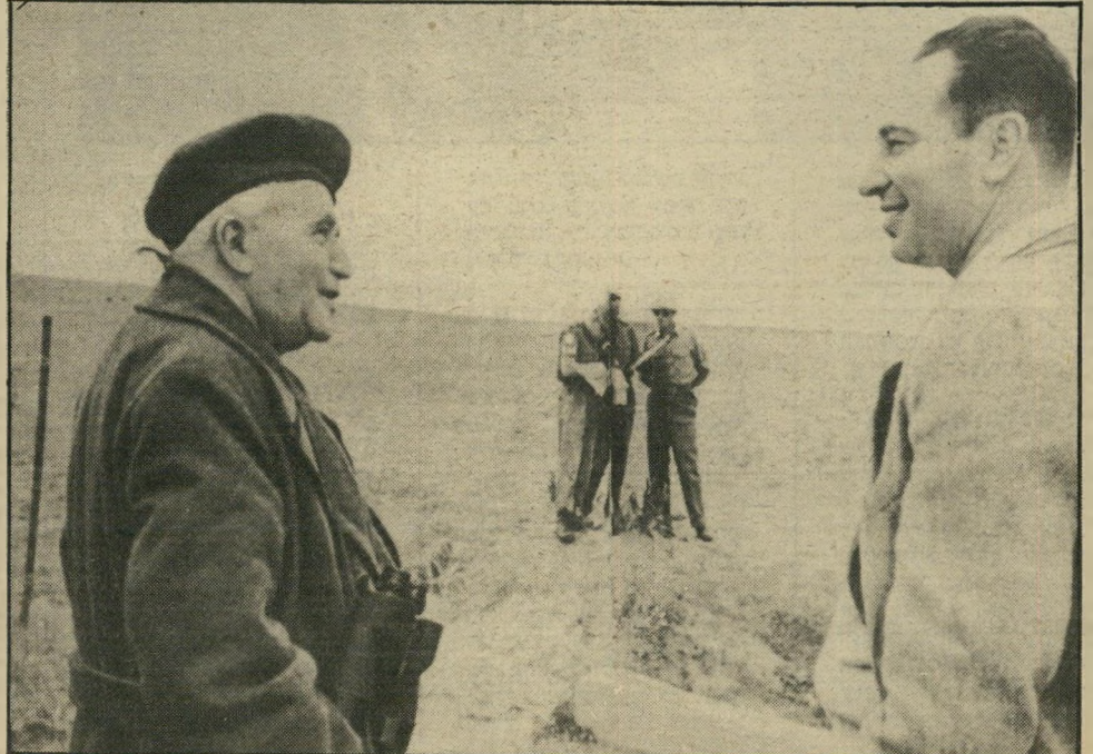
מנכ"ל פרס עם ראשי-הממשלה ושרי-הביטחון בן-גוריון כמו מעשה-קונדס שובב

● הבריטים, בהנהגת סר אנתוני אידן, רצו להפיל את עבד-אל-נאצר.