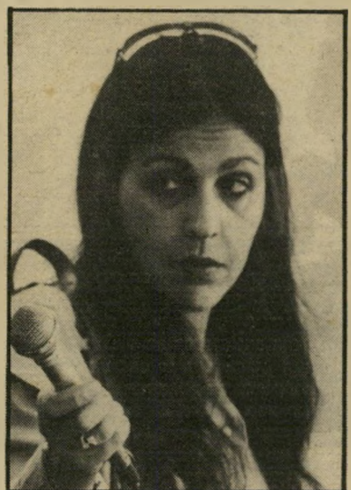
כתבת מנשה שקרנית?

אכן שודרה במהדורת החדשות של השעה 9 באותו בוקר.