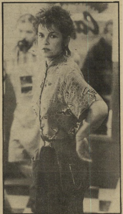
שחקנית בוזולד הפתעת העונה

הברית): זו הפתעה אמיתית. סרט קטנטן, מלא מישחקי-סיננון, ציטוטים ומילון-מפתח לאנשי קולנוע, כבש את הקהל התל-אביבי, בהחלט בסערה. אלן רודולף הוא הבימאי, לורי סינר ו'נבביי בוז'ולד הן הצלעות הנשיות, והגברים הם כריס כריסטופרסון, המזדקן מהר, וקית קארדין, המבריק והגונב את ההצגה.