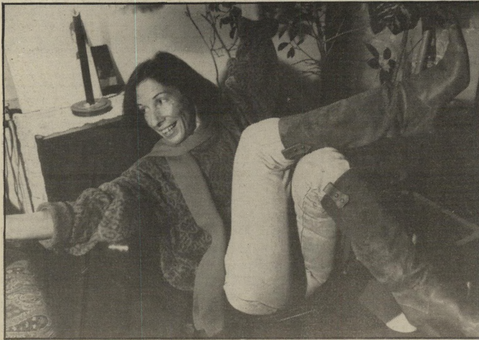
עדנה השבוע. תבוא בני! תהיה בני! אהובי!

מות-הדם והתשוקה המפכים בהם זה אל זה כמים רבים הזורמים בערוצי האדמה אחרי סערת גשם, מחבקים זה את זה ברכות בעודם שבים אל גדותיהם. מחוץ לספר היא מוכנה לתאר את דמות המאהב האיריאלי בעיניה: „אני רוצה גבר בלי שום סביבה, בלי שום רקע, רק אותו לברו, לא רוצה לדעת אם הוא נשוי או פנוי, לא רוצה לדעת עליו, לא ממנו ולא מפי אחרים. אני גם לא רוצה שיבטיח לי כלום.