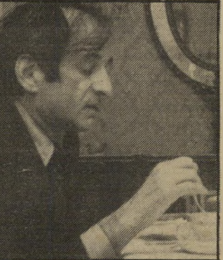
חתן-פרס ויזל קשר-השתקה

סביב עברו הישראלי של אלי ויזל, חתן פרס-נובל לשלום, ויזל עצמו אינו מזכיר את העובדה שעלה לארץ בשנת 1948, אחרי מילחמת-העצמאות. אחרי ששוחרר ממחנה-ההשמדה, היה ויזל בקבוצה של 300 נערים ונערות יהודיים. לחברי הקבוצה הוצע לעלות לארץ בעליה בלתי-ליגאלית. רובם עלו, ויזל לא רצה או לעלות, והסכים כי הוא מעוניין ללמוד בסורבון בפאריס. אחר-כך עלה לארץ ושימש מדרוך חברתי בחוות-הנוער של ביתר, על-שם יוהנה ז'בוטינסקי בכארי-יעקב. בתקופה מסוימת אף שימש ככתב של ידיעות אחרונות, ודמשיך בזאת כשנשע, ב-1950, ללימודים בפאריס.