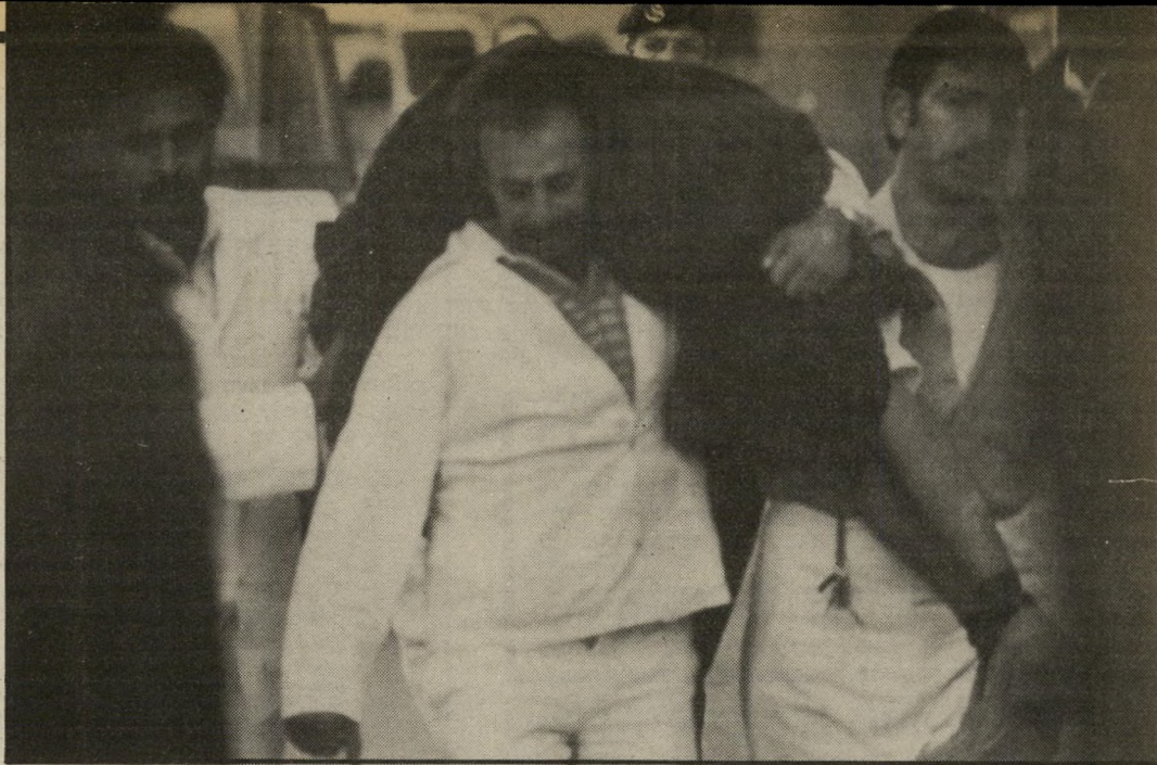
אבי הדרוג על גבי חובש ברמאללה, אחרי שהתעלף ריזות בבית החולים