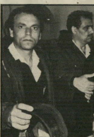
מלכה (צוחק) בכניסה לבית-המישפט. אני עובד על עצמי על-ימנת לא להשתגע...

שאני פוחד, אלא שאני רואה במישפט זה כעין מחזה או מישחק. כי כפי המאוננים נטויה לצד מישפחתה, וזה עלול להיות מישפט לא צודק, כי לפי