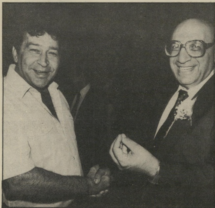
בעל השליחיות העלומות: ח"כ בנימין ("בואד") בן אליעזר