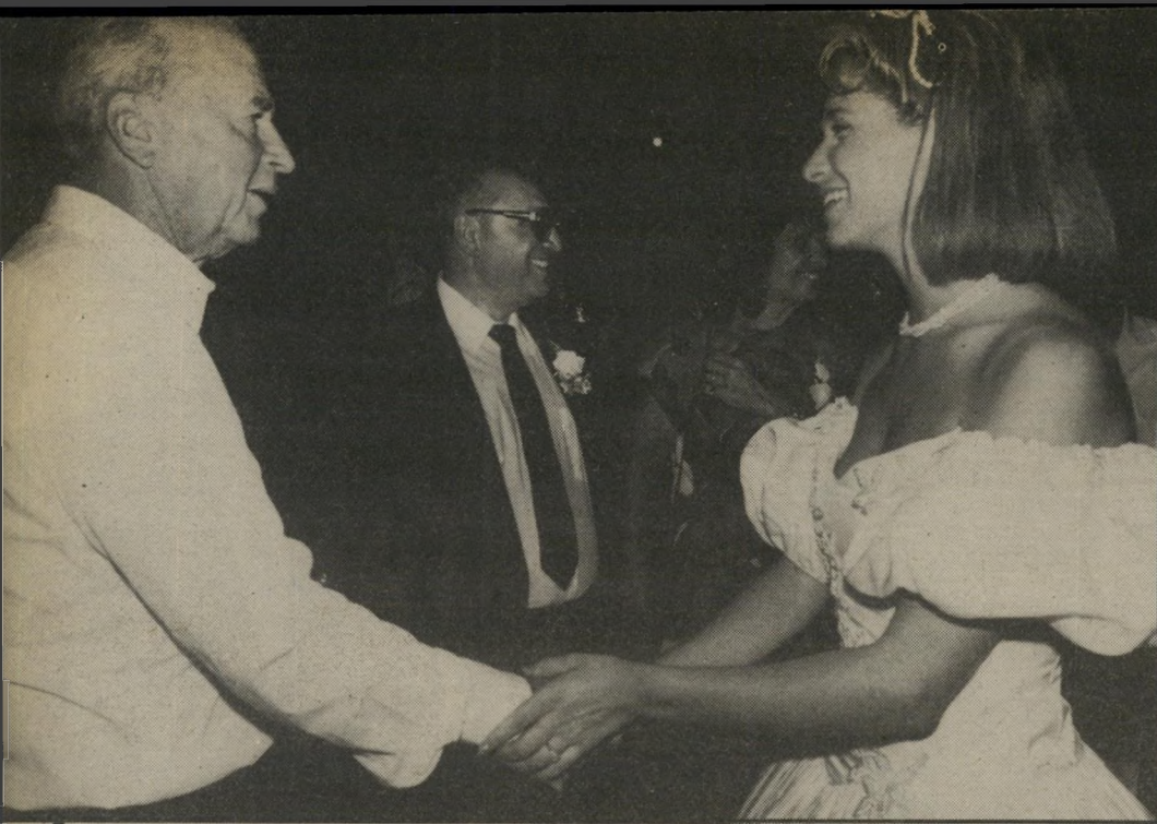
המוזנה על עיסקיהנשק: שר הביטחון יצחק רבין עם הכלה