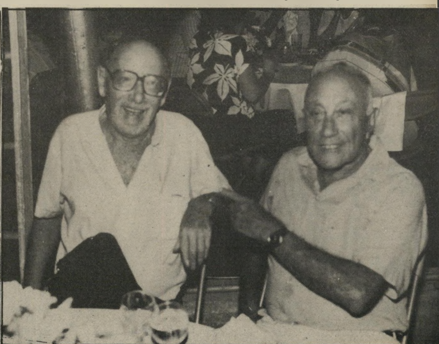
ראש המוסד לשעבר: מאיר עמית (עם יגאל מוסינזון)