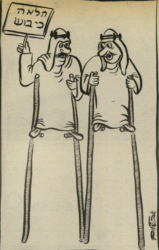
"זה כדי שהחיילים לא יפספסו את הרגליים!"

הפגנות אהדה בישראל עצמה (ראה עמודים 6-7). הפרשה של עיסקת-הנשק עם איראן, שישראל שקעה בה יותר ויותר (ראה להלן). הידיעות על מערך אימנתי של לוחמה כימית, ההולך וקם בסוריה, בעיראק ומי יודע היכן עוד (ראה הנדון). החלטת שר המישפטים שאין להסי גיר רוצח למדינת-חוק ידידותית, מפני שרצח רק ערבי. (ראה עמודים 8-9). החלטת הצנזורה האמנותית לאסור