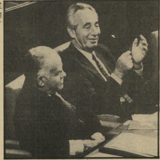
פרס עם שמיר

לא נאמרה בישראל אף מילה אחת בפרשה זו, שלא נסתרה עליידי מישוה אחר בישראל, או עליידי ידיעות שהופיעו בכלי-התיקורת הזרים. אנחנו שוחים בים של שקרים ושקרים-נגריים, כשכל אחד מנסה להציל את עורו.