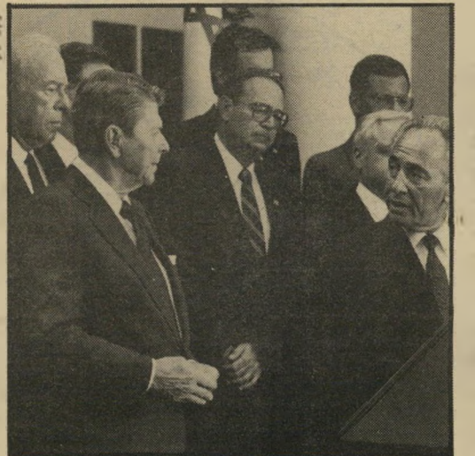
פרס עם רגן

כל זה מתוך אמונה מטופשת כי הדברים לא יתגלו — אותה האמונה המטופשת שהביאה לפרשת