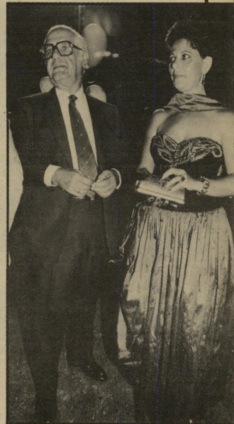
רותי ויוולי עופר על שם מי הווילה?