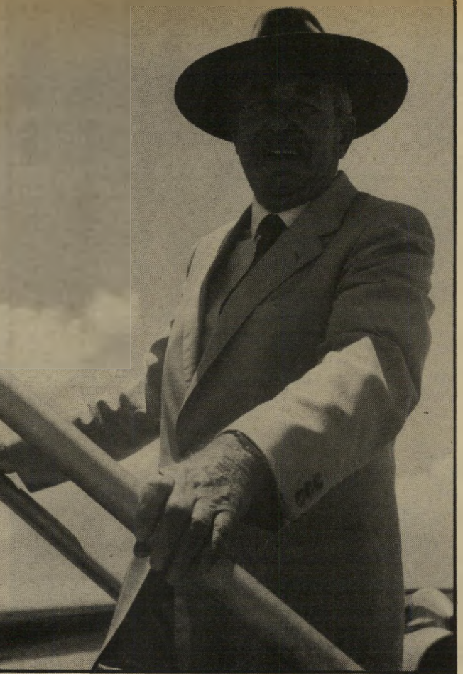
נשיא-המדינה באוסטרליה איזה מבט?

הוועדה יקבל ביום השני אחרי-הצהריים, זמן קצר לפני ישיבת הוועד המנהל וישיבת-המליאה הוסעת.