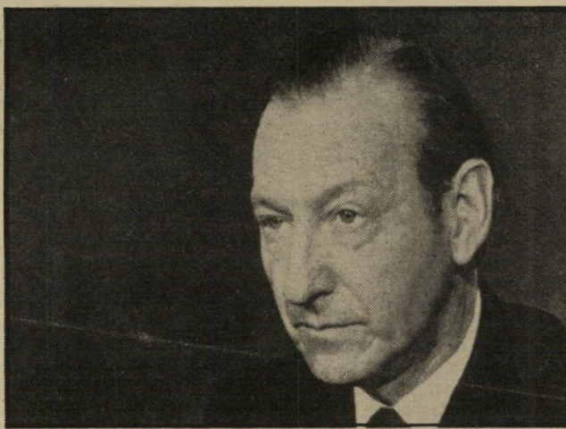
נשיא ולדהיים לא מעניין!

לפני נסיעתו של חיים הרצוג, עלתה האפשרות שיבין יצטרף בעצמו למסע ויכין במהלכו סרט מקיף על הביקור בארצות השונות. יבין שקל את העניין והחליט, לבסוף, שלא לנסוע, אך