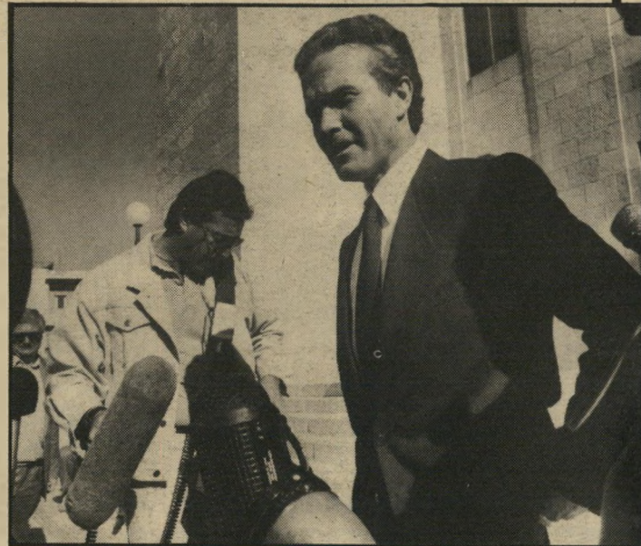
פרקליט אוקונור מתלונן לפני העיתונאים איומים טלפוניים וכתובות נאצה