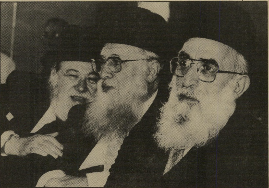
שלמה גורן לשעבר הרב הצבאי הראשי והרב הראשי לישראל — גרס לסקרנות סיביו נודעו כידידותיים במיוחד. לצמד-חמד הזה הצטרף רב שלישי, הלא הוא הרב אברהם שפירא (משמאל).