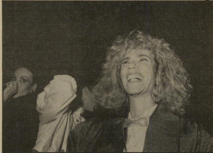
עירית חדר רקדנית צעירה שהופיעה לאחרונה במחזור גבירתי הנאוה. בלטה בהופעתה בעניבת-הפרפר הזוהרת שלה במועדון הסינרמה. למסיבה הדחוסה הגיעו המונים.

אלפים רבים צבאו על הדלתות. ברי חובות הסמוכים נוצרו פקקיתנועה חמורים. שרותי-החרום העירוניים הר עמדו בכוננות. פן יתרחש אסון. היה מי שספר במקום 6000 איש. כל המהומה היתה סביב מסיבת-הה מונים שערכה רשת העיתונים מוניי טיגן-גלובס-כספים. בשיתוף עם דיס קוטק הסינרמה, בשבוע שעבר.