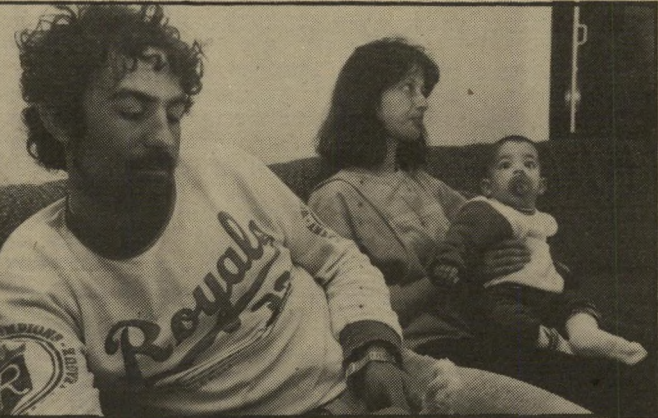
מישפחת עטיה הם לקחו לנו את הדירות!