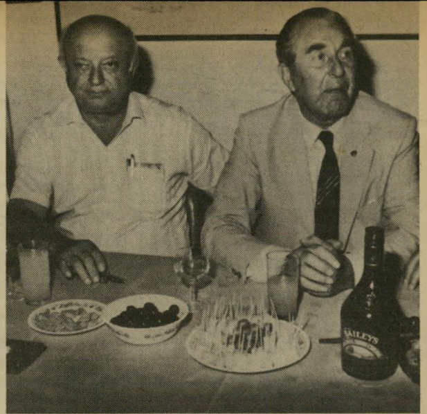
הנשיא חיים הרצוג, ערך לפני זמנמה ביקור בגמל חיפה וכאשר הזמנה הפמליה הנשיאותית לכיבוד קל, בלט על השולחן בקבוק בייליס אייריש קרים, מוכן להשקת כוסית.