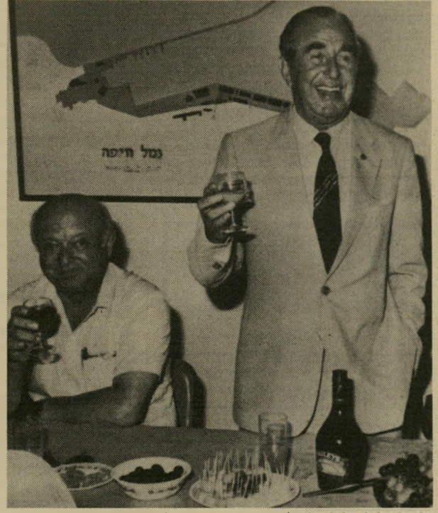
והכוסית לאחר שהנשיא נוכח לדעת שהבייליס הוא מקורי וגם קיבל אישור על כשרותו, שניתן במקום הידוע לנשיא היטב מימי נעוריו — בית-הדין היישוב בבית הרצוג (על שם אביו המנוח של הנשיא, הרב יצחק אייזיק הלוי הרצוג, שהיה בשעתו רבה הראשי של אירלנד) ברחוב ציון שכראבלין, בירת אירלנד — הרים הנשיא כוסית בייליס.