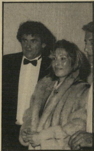
פרוון שחר ודוגמנית

לארץ הגיעו הפרוונים הראשונים באמצע שנות ה-30, ממיורח אירופה, אבל הקונים לא עטו עליהם בהמונים,