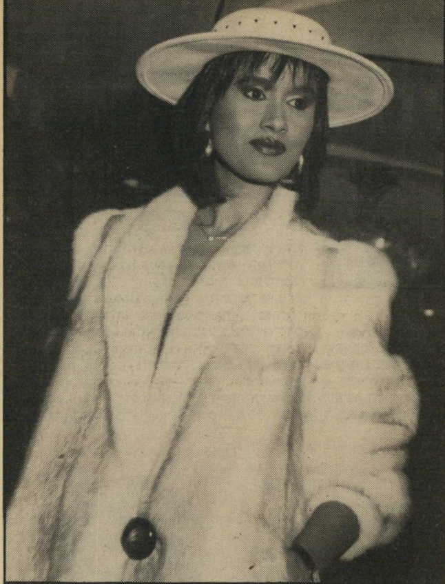
שועל: יש שיבעה סוגים שונים