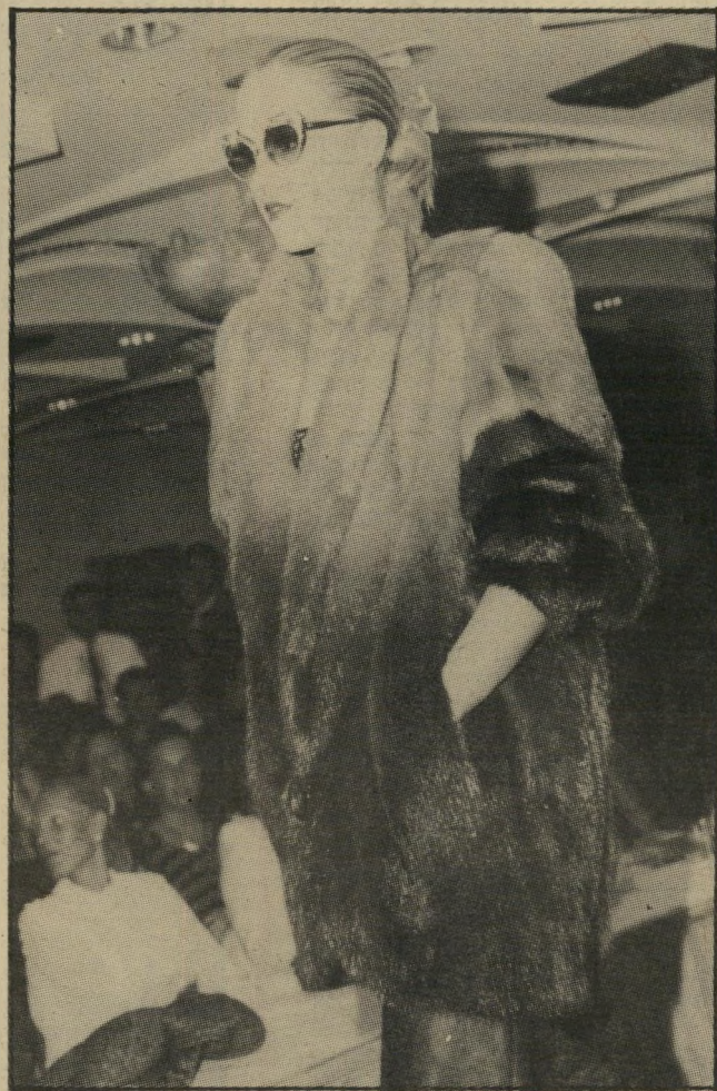
מינק: מגדלים את החיה רק למען הפרווה