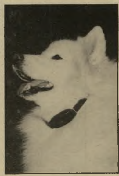
יבואן אחר שלח לי את הצילום של הכלב המשגע הזה, כשעל צווארו תלוי מכשיר אלקטרוני.