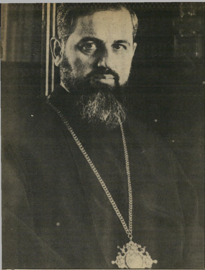
ארכיבישוף עג'מ'יאן החיים הטובים

שרד את הכנסיה ורימה את הפטריארך בכל הקשור לכספי הכנסיה, וכן כתב שופטריארך מסר לעג'מ'יאן צ'ק על סך 250 אלף רולר לבניית כנסייה בהר ציון. הכנסיה לא נבנתה. הכסף לא הוחזר. אל-פאגאר אינו חוזר בו מדי בריו. הוא רק מבטיח שלא לפרסם עוד את שמו של עג'מ'יאן.