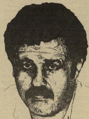
מיינמד לגוריט הנייה דרוקמן לחץ

ניסיתי להשיג את שצ'רנסקי, כי שמעתי מעיתונאים שהוא נתון תחת לחץ אריר וחשבתו שכדאי לחזק אותו. שצ'רנסקי לא ענה לטלפון ודיברתי עם העוזר שלו. הוא אמר ששצ'רנסקי מאוד כועס שניסיתי לפגוע בו. אמר שהפגישה היתה סודית, והעליל עליי