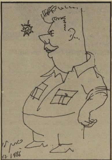
גת, 1986 (צייר: לוריא) — לזכר שנות ה-50

עוד על חופשה-הבעה מעל עמודי העולם הזה (מיכתבים), העולם הזה (5.11.86). הקוראה דרורי לא גילתה את אמריקה. לא רק