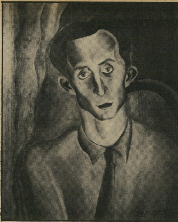
צינה תגר: אורי צבי גרינברג

אותם ימים, חזר מפאריס ופתח "סטודיו" מודרני שבו למדו אלה המכונים אמני "הדור השני". הוא הציג בתערוכה ציור אותו כינה בשם "חיבור ללא עצמים". הצופים הופתעו: ציור כזה — מופשט גיאומטרי — לא נראה עד אז בארץ-ישראל. אבל מאז לא ראה איש את הציור — עיקבותיו נעלמו, ופרנקל עבר לצייר בנוסח "אסכולת פאריס" היהודית.