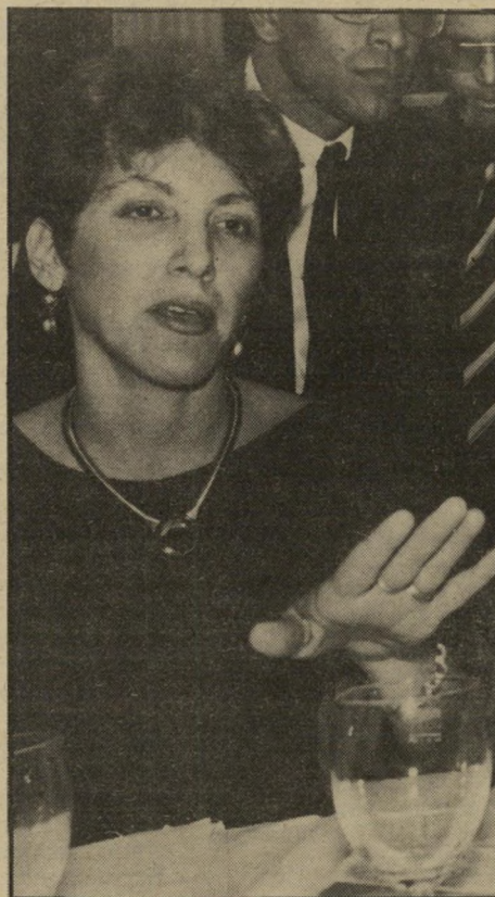
ממתינה ליבנת ממשיכה במצודה

ד רוטאציה התקיימה. שימרון פרס הגיע. כמתוכנן, למישיכונשיא ישראל להדיע על התפטרותו. ראשי המערך ניסו לעשות תרגילים קטנים — כלי מודעי, מיזכרהבנה, היועצים יישארו. יצחק שמיר הציג את ממשלתו לפני נשיא המדינה כמתוכנן. אבל הרוטאציה האמיתית מתבטאת במישרד ראשהממשלה ובלישכתו. שמיר אינו אוהב את התיק שורת. זה כבר עניין נדוש. לעומת מנחם בגין ושימרון פרס אחרי, שמיקמו את היועץ לענייני תיק שורת בחדר שמול לישכת ראשהממשלה. העדיף שמיר להרחיק את היועץ אל מעבר לדלת הזכוכית. בין אבי פזר ויוסי אחימאיר לבין יצחק שמיר מפריד מיסדרון ארוך, שבסופו דלת זכוכית. על הדלת קבוע לוח מיספרים, ורק מי שיודע את קבוצת המיספרים הנכונה יכול לפתוח את הדלת ולהיכנס ללישכת ראשהממשלה. על דלת חדר התיק שורת, הממוקם במיסדרון היועצים, לא הספיקו לקבוע שלט. תלוש נייר ממחברת, כתבו עליו בכתבי יד לאיברור "תיק שורת", וחיברו בנעץ. עוזרו של פזר, יוסי אחימאיר, יעזוב ככל הנראה את לישכת ראשהממשלה כבר בחדש דצמבר הקרוב. אחימאיר קיבל הבטחה מפורשת משמיר: הוא יהיה מנהל לישכת העיתונות הממשלתית. המנהל הנוכחי, ישראל פלג, כבר הודיע שכל מי שירצה להחליפו, יצטרך לפטור. אבל גם בעניין זה הצליח שמיר. במיזכרהבנה שנחתם ערב הצגת ממשלתו נאמר ששמיר יוכל להחליף את היועצים, ללא כל התייעצות, אלא רק בהודעה. העיסקה שנערכה בין הליכוד למערך מבטיחה לאחימאיר את לישכת העיתונות הממשלתית. פלג יחליף את מיכה ינון, יושב ראש רשות השידור. ינון יסיים את תפקידו בחדש מרס '87, אך בלישכת ראשהממשלה אומרים שפלג יסיים לסיים את תפקידו כבר בדצמבר, ולהמתין בחופשה לתפקיד האחר.