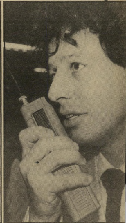
ראש לישבה הנוגבי חליפה בהירה ועניבה