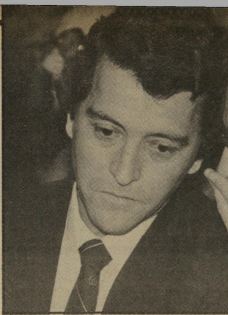
עוזרי יועץ אחימאיר דף נייר תלוש ממחברת

מה אמר שמיר לבן-אהרון כשהגיע למישרדו באותו בוקר? למחרת היו כל עיתוני הבוקר, בשעה 5 ורבע, אצל ראשהממשלה.