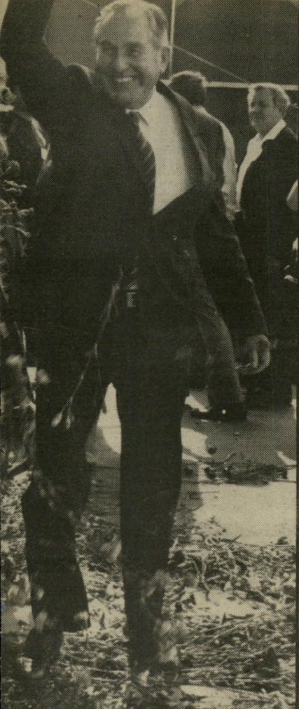
הנשיא הרצוג וגם טרט מיוחד

כל זה ייצא אל הפועל אם תיפתר בעייתם של העובדים, שהודיעו חרי-משמעת שהם לא יסעו אלא אם ישלמו להם דמי שעות-נוספות עבור