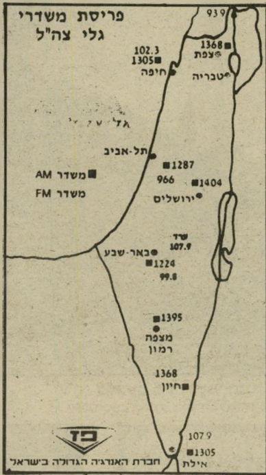
מפת גל"ץ איפה בסקאלה?

כרטיס קטן, שמצידו האחד מפת-הארץ, ובה מסומנים המיקומים שבהם ניתן לקלוט את שידורי התחנה בכל אזור. מצידו השני של הכרטיס יש לוח-שנה. הכרטיס מופץ בימים אלה לכל חיילי צה"ל. הוא גם נשלח לכל אורח המבקש זאת, וניתן לכל אחר המגיע לתחנה הצבאית לביקור.