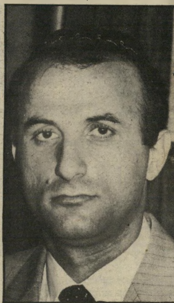
מכנס גרוזים גור מן העיריה אל הכנסת

באירופה, הזרקנו. רוב הצעירים הי אשכנזיים נולדו בארץ ואין הם מגלים עניין בנוסטלגיה. ואילו צעירי עדות המזרח, ברובם הגדול, לא נולדו בא-