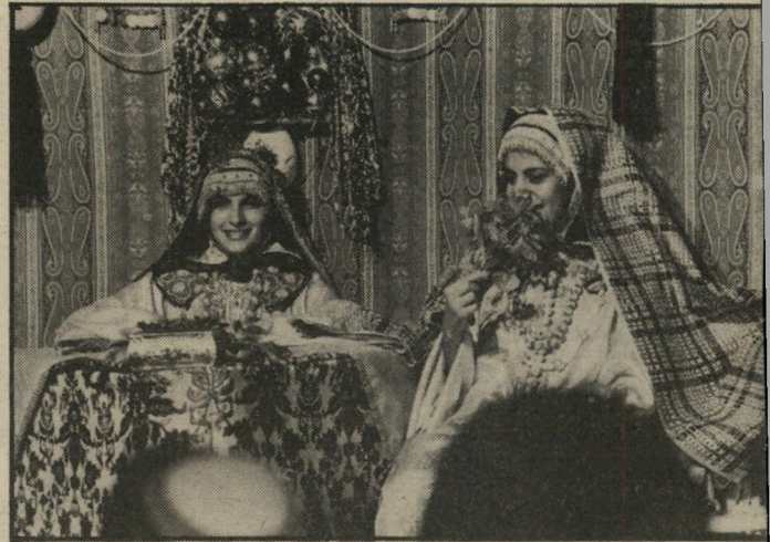
חרריולדות תימני בתמן התלבבושות היו יפות יותר!

רץ. הם עדיין חיים את זכרונות העבר, ויש להם רי כוח כדי להחיותם."