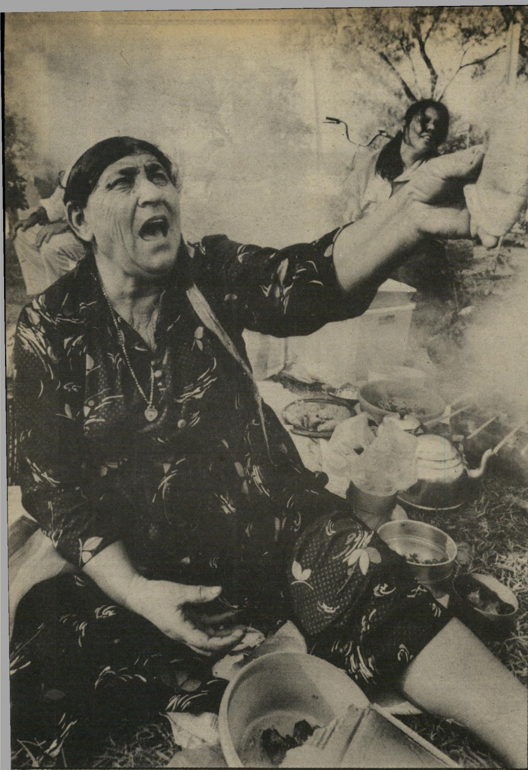
יוצאת כורדיסתאן מושקה כבר בדרך לארץ התחילו הצרות..."

באירופה, הזרקנו. רוב הצעירים הי אשכנזיים נולדו בארץ ואין הם מגלים עניין בנוסטלגיה. ואילו צעירי עדות המזרח, ברובם הגדול, לא נולדו בא-