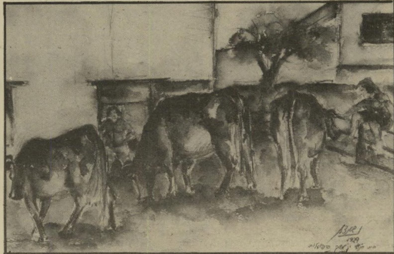
נחמיה שטנצל: משק הפועלות תל-אביב, 1929. כיום רבי-קומות ברחוב ארלוזורוב

בבוקר, בטרם קמתי משנתי, כבר שמעתי את ציוץ הציפורים בגן. התעוררתי לפתע. לירי שככה מירב, ישנה, כמו שותקת, וכמו מברבת. היא לא שומעת את ציוץ הציפורים. היא מעפעת בעיניה, את הוא כי שמעה אותי מהרהר בה. פיתאום היא קמה. במהירות, לא הספקתי לראות