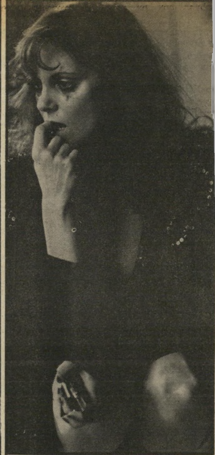
לסלי אן וורן שתי היפות והמוכשרות של אלן רודולף ב"בחר בי"

דבר דומה אפשר לומר על אלני של פיטר ייטס. גם אם הסרט משחזר בנאמנות את פרשת חייו של עיתונאי אמריקאי ממוצא יווני, שאמו נרצחה עליידי לוחמי המחתרת הקומוניסטית ביוון, בסוף שנות ה-40, הרי הדרך שבה עושה הסרט שימוש בסיפור אומרת רק דבר אחד: הקולנוע מן הימין היו אבירי הסדר הטוב, ואילו המחתרת היתה מורכבת מקומיסארים צמאידים, אשר חיסלו כל מי שנחשד בעיניהם כאוייב העם. מה שיכול להיות נכון במיקרה בודד אחר, הופך לנוסחה מסוכנת ביותר כאשר מייחסים אותה לכלל זהו בדיוק מה שסרט זה עושה, בדיעה צלולה ובמצח נחושה. העובדה שהוא משתמש בכמה מן הטכניקות של הסרט הסובייטי כדי להטיף נגד האידיאולוגיה הסובייטית רק מוכיחה עד כמה רודנויות משני הקצוות נפגשות בקלות, כאשר מדובר בשפת הפרופגנדה.