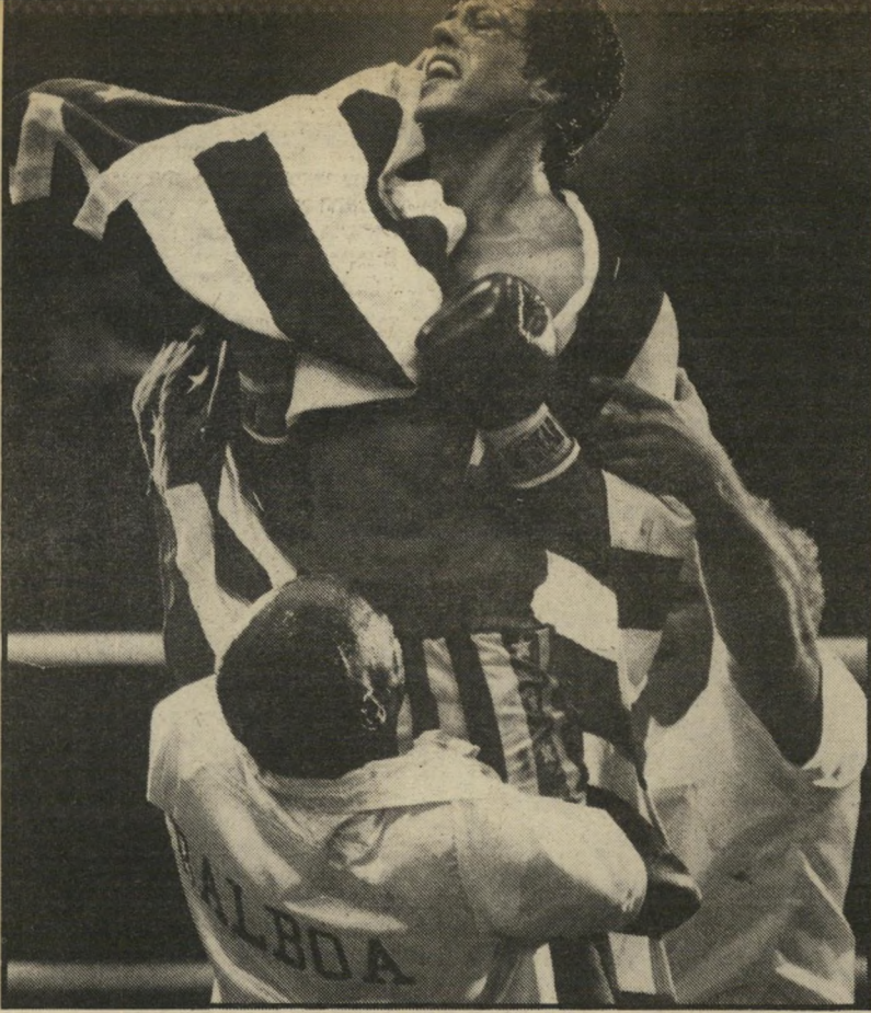
סילבסטר סטאלונה ב"רוקי 4" סירטירגן המשתוללים