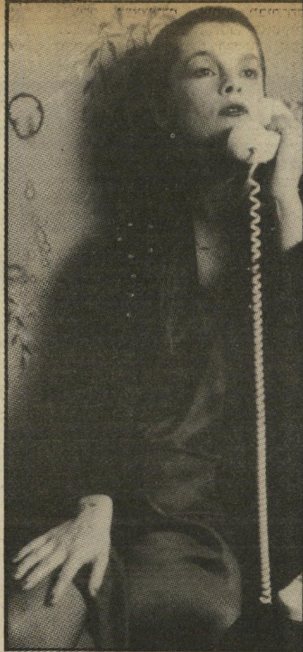
זנבייב בוזולד על רשימת הסרטים הרעים של