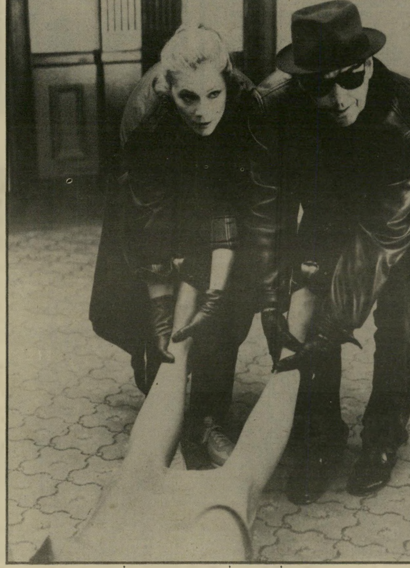
ג'ק ניקולסון וקאתלין טרנר ב. הכבוד של פריצו כל שלל הטקסטים והמניירות

לבכמה שאינו חדש, אבל זכה להכרה בישראל רק השנה: אלן רודולף. שני סרטיו, בחר בי ובעקבות הכרך, ובמיוחד הסרט הראשון, מצביעים על כישרון רב הן בצורת-ההגשה של סיפור, הן בהדרכת השחקנים, הן ביצירת אוירה של קסם בעזרת מצלמה, תפאורות ופס קול. תופעה חריגה נוספת — הצגת היימאט של ארגר רייץ: אפוס מישפחתי ארוך, עשוי ללא רכב מבחינה קולנועית, שעורר בישראל התפעלות וזעם גם יחד. התפעלות בזכות העשיה, וזעם על הדרך שבה מחליק הסרט על השואה, למרות העובדה שהתקופה המתוארת בו היא זו שכי השנים 1919-1982. ראייה נכונה של הסרט מצביעה למעשה על האחראיות הנוראה הרובצת על העם הגרמני: לא זו בלבד שחלק מהם היו אחראים ישירות להשמדת עם, אלא שחלק אחר, זה שלא הוציא לפועל, עצם עיניו וסירב אפילו להפנות מבט לכיוון שם עשויים היו להתגלות בפניו מראות לא נוחים למצפונו. את זאת אומר הסרט בפירוט, ואס אין הוא שם סימיקריאה ליד אמירה זו, ואינו מפרט כתב-אשמה, הרי שזו דרכו להעביר את רוח הדברים. הצופה צריך להסיק את המסקנות בעצמו, אם הוא בשל לכך די הצורך. ארבעת הגדולים. אם צריך לבחור את ארבעת סרטי תש"ו, אלה הראויים לשימחלב והערכה יותר מן השאר — להוציא מן הכלל את שואה, השייר לעולם אחר — העין מתעכבת על יצירת-מופת של דור הענקים, התרומה האחרונה בניתיים של גאון אמריקאי, המשתפר מסרט לסרט, ושני סרטים של צעירים, העושים את צעריהם הראשונים והמבטיחים ביותר בעולם הסרטים. יצירת המופת, שאין עוררין עליה, אפילו בין אותם שלא נסחפו בעצמתה עד הסוף, היתה ראן של אקירה קורוסאוה. העיבוד היפאני המהמם בעוצמתו והמלך ליר. זאת חוויה בלתי-נשכחת, חזותית ודרמאטית גם יחד, שיא חדש ביצירתו