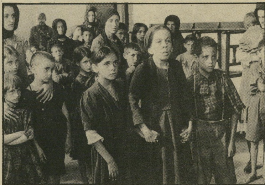
4. אלני (ארצות-הברית)