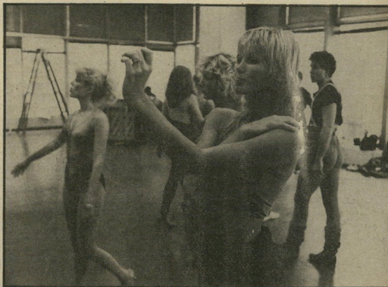
3. שורת המקלה (ארצות-הברית)