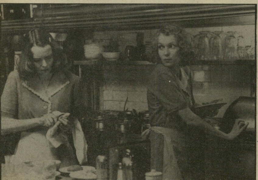
2. שיכרון חושים (ארצות-הברית)