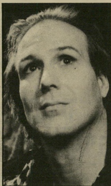
שחקן השנה ויליאם הרט נשיקת אשת העכביש

ב סך הכל, תשמ"ו היתר שנה לא רעה כלל לקולנוע בישראל. וזאת למרות היכבות הבוקעות מכיוון הענף, המאמין באמונה שלמה כי דמעות הינן סגולה כנגד עיז-הרע. הקולנוע הישראלי מידרדר והולך, מתפרק והולך — כך היה כתוב בעיתוני-החג. אין ספק שיש אמת בדבר, אם מנסים למרוד את הסרטים מתוצרת-הארץ בסרגל ההגיון. אלא שאותו הסרגל מצביע על אותן מסקנות מדי שנה בשנה, איש אינו יכול אפילו להתחיל ולהסביר כיצד הגוויה הזאת גוססת כליכך הרבה זמן, ותוך כדי כך מפרנסת אנשים רבים כליכך. זה אחד הניסים של ארץ זו, שאינה מפיקה עוד חלב ורובש בחינם. ואם זה היה כך בשנים עברו, מתקבל על הרעת שזה ימשיך להיות כך גם בעתיד. המיספרים האיומים שנרשמו בקופות כמה מן הסרטים הישראליים הם אומנם מפחידים מאוד. אך לעומתם כמה וכמה סרטים שברו את מחסום 100 אלף הצופים — לא די בכך כדי לכסות את ההוצאות, אבל מספיק, כנראה, כדי להבטיח המשך לסרט נוסף: שלא לדבר על המיספרים המזהירים של יהודה ברקן, הטוען למיליון צופים ויותר בשני סרטיו השנה, קומפוט נעליים ובעיקר ניפגש בסיבוב, או בהישגים הנאים של שתי אצבעות מצידון, הממשיך לרוץ בכל רחבי הארץ. כמרץ רב. בוכים ועוברים. אבל מוטב שלא להיכנס לשדה-המוקשים של כלכלת הקולנוע הישראלי,