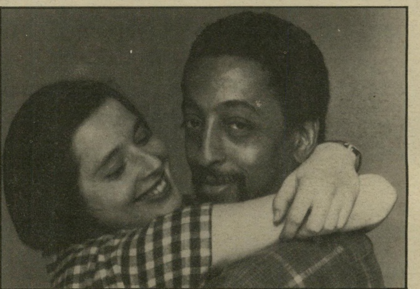
1. לילות לבנים (ארצות-הברית)