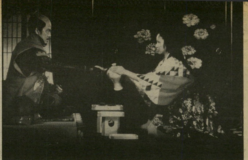
1. ראן (יפאן)