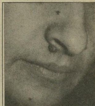
לפני הטיפול ב"סולקודרם"