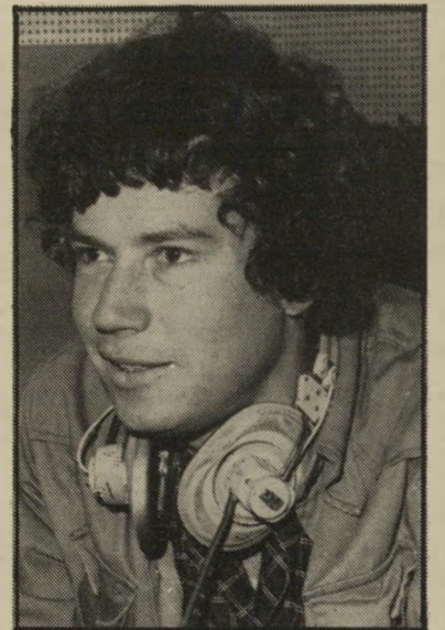
כתב סוקניק נתונים מזעזעים, סודות חסויים

● לניסים מיזשעל, כתבנו בווישינגטון, שעלה על דרך-המלך ואינו מפסיק לשלוח כתבות-לוויין למולדת. מקצת אנשי מחלקת-