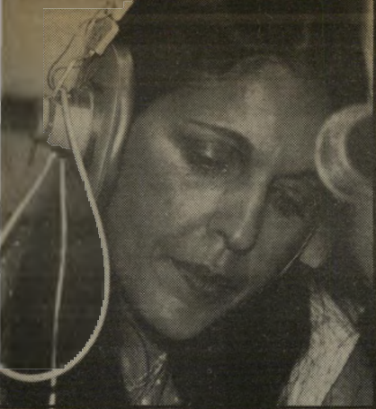
כתבת מנשה ברגע האחרון

ונות, ומישוה השתמש בניירות אלה כדי להלבין מכונית גנובה אחרת מאותו הסוג. הוא הצמיד למכונית הגנובה את מיספרי-הרישוי של מכונתו של לביארי, שניירותיה היו בידיו, וכך חשב למכור אותה. לרוע מזלו, הוא נתקע איתה אישם כנגב ונטש אותה.