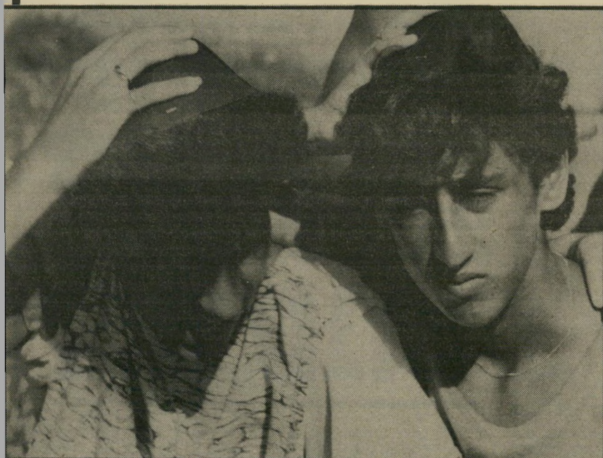
גיל אלעזרוב: חברים בהלוויה של קורבן חברות-הנוער

כאשר התברר כי כדי למנוע את הענשתם של רוצחי-החוטפים באוטובוס 300, עשה ראש השי- ב"כ, אברהם שלום מעשים שונים, שהם נגד שיבוש הליכי-המישפט, ושיתף בכך עוד כמה מפקודיו, התחילה הפרשה לתפוס תאוצה חדשה. היועץ המישפטי הקודם, יצחק זמיר, דרש להעניש את האשמים ולברר את הפרשה העניין הסתבר וגרם להתערבותו של שימעון פרס ולהרחת היועץ המישפטי. שלושת אנשי שב"כ שפתחו את הפרשה הגישו עתירה לבג"ץ כדי