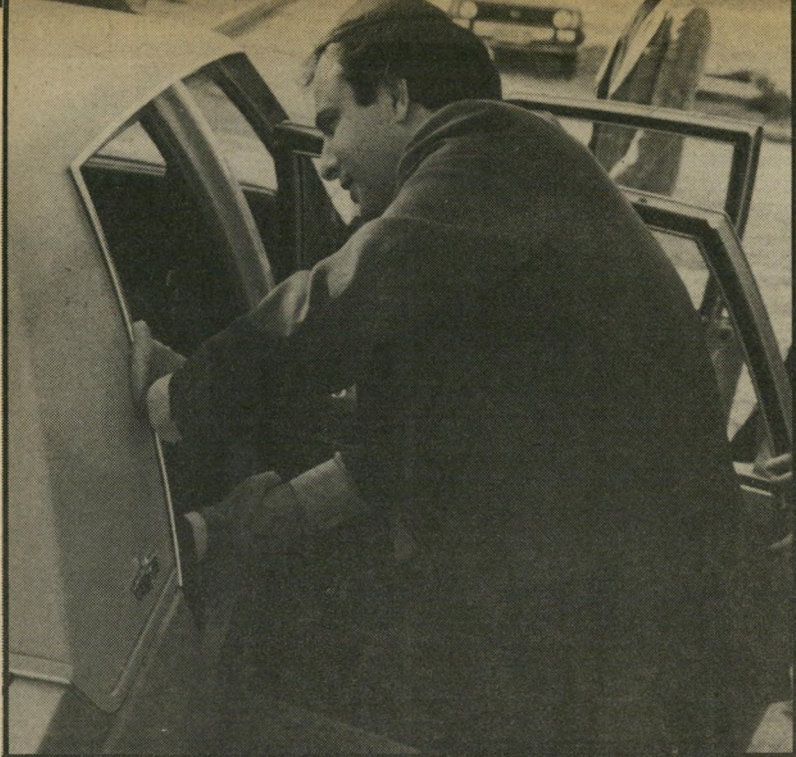
דויד בגס לוחץ ידו של שימעון פרס היושב במכונית

מהתפרעויות הרתיים ומהעונשים הקלים המור- טלים עליהם. ככמה פעולות-הגמול הפרטיזניות נפגעו כמה בתי-כנסת.