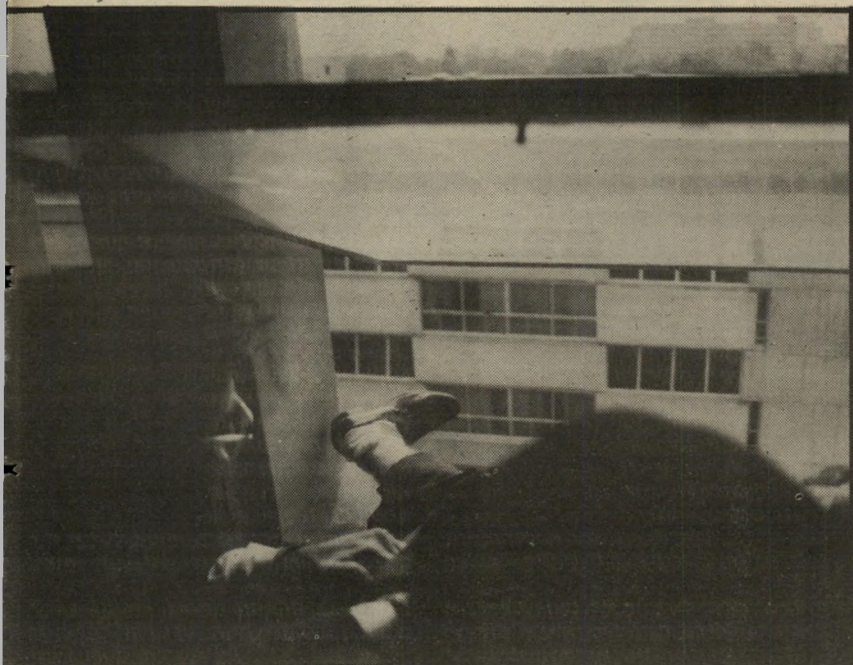
אברהם גינדי: נסיון ההתאבדות הראשון קפיצה מחלון בית-המישפט

גינדי , שנותר כארץ, היה עצור זמן רב, וניסה להתאבד עוד בבית-המישפט. הוא לא הצליח בפעם הראשונה, ואז ניסה שוב ושוב, עד שלבסוף התאבד בכריכת-השחיה הפרטית שלו. גם הוא הסתבך בעניינים פליליים וכלכליים שמקורם בקרקעות בשטחים הכבושים.