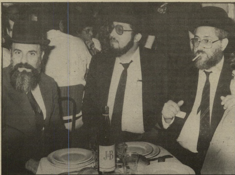
יצחק פרץ רבה של עיר ואם בישראל (רעננה) וכיום שר-הפנים, נתפס בעדשתו של צלם-ניצב בקבוק ויסקי ג'יי-אנד-בי מוכן ללגימה. לתדהמתו של הצלם לא היה יסוד. לפי ההלכה היהודית, הוויסקי איננו נחשב יין-נסך (יין שנגעה בו ידו של לא-יהודי, ועל כן הוא אסור על יהודים שומרי-מצוות).