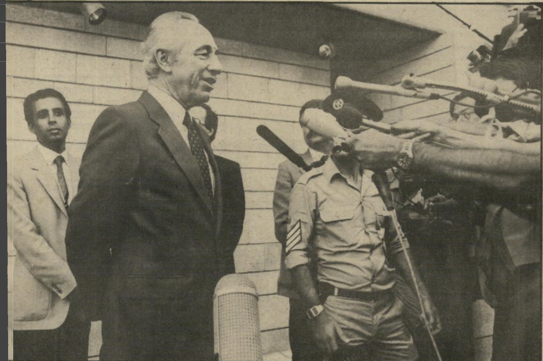
שאלות אחרונות עשרות נציגי אמצי-עיהתיקשורת המי-תינו לפרס בבית הנשיא. כשיצא משם, אחרי שמסר את מיכתב ההתפטרות, הם עטו עליו בשאלות. הוא היה נינוח והסכים לענות כמעט לכל אחד מהם. הוא אפילו חייד לעבר העיתונאים הרבים שעמדו מולו.

קפיצה לפאריס שימעון פרס אינו נרתע מן העם. הוא מוכן, או לפחות כך בימיו