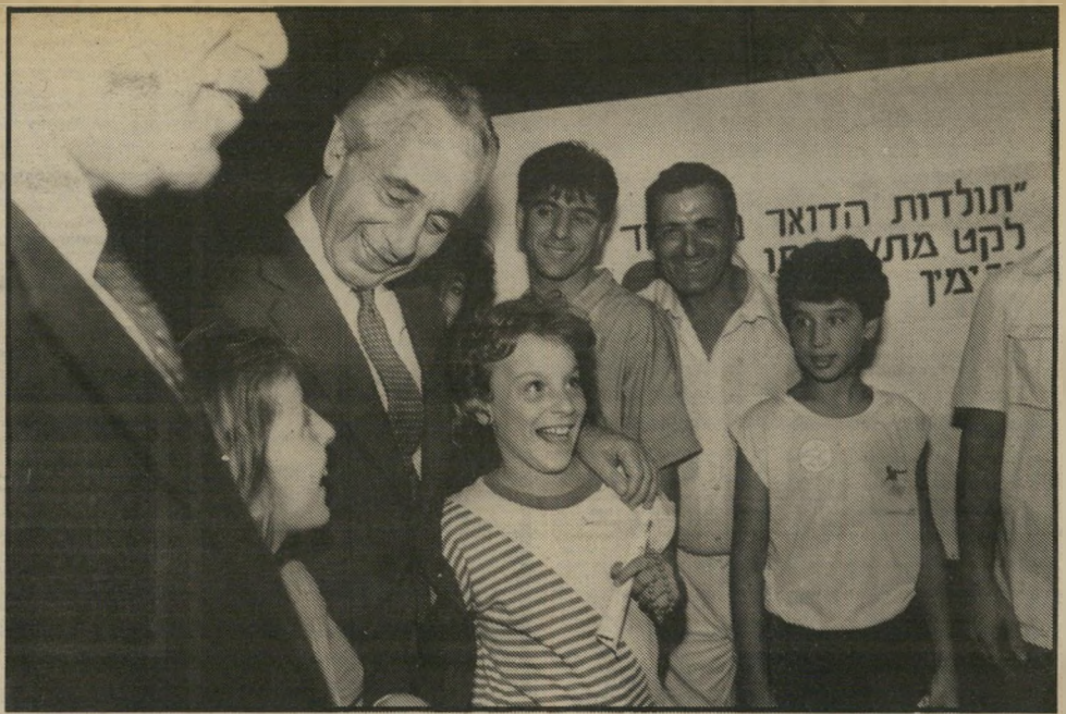
זקנים וטף פרס בביקור באשדוד. הוא עשה סיור בתערוכה שתעודה את ראשית העיר, ובדרכו התחבק והתנשק עם כל מי שנקרה בדרכו. הוא הירבה לחבק ילדים והסכים להצטלם עם כל מי שרצה. אזרחי אשדוד נדחפו ודחפו - כדי לזכות בתמונה עם ראשיהממשלה.

לם הגדול בנמל-אשדוד. הם התלכשו במיטב בגדיהם והתכוננו לאירוע החי שוב עם ראשיהממשלה. ותיקי ומייסדי העיר היו בין המזומנים לערב. הם נשאו תיהם, הן ובעליהן, גם כל פרנסייהעיר היו שם בהרכב מלא. חנוטים בחליפות מצוחצחות. להם היו מקומות שמורים בשורה הראשונה, כל כיסא ושם המכור בר שום עליו. קצת לפני השעה היעודה נכנס פנימה רפי סויסה, מי שהיה נציב שיי רתם האחד עם השני התערבבו ביניהם, שוטרים מקומיים במרי חאקי מצווד צחים הצטופפו ליד אנשי מישמר הדי גבול בכומתות ירוקות. אלה גם אלה קיבלו הוראות מאנשיהכיתחון של פרס, שבאו למקום מבעוד מועד כדי לארגן את השמירה על ראשיהממשלה. ואז, כשההומה כבר היתה בשיאה החליקו מאישם, מתוך העלטה, שתי מכוניות אמריקאיות מוכספות ועצרו בחריקה ליד פתח האולם. עשורת במהלך הערב העניק ראשיעיריית אשדוד אזרחות כבוד לראשיהממשלה ופרס, שהכין היטב את שעוריהבית שלו, ידע לנקוב בשמם של כל מי שקיבלו באותו הערב ביחד איתו את התואר "יקיר אשדוד". הוא גם ידע לדבר אל ליבו של הקהל, שהיה מורכב ברובו ממיזרחיים תושבי העיר, והזכיר להם כי בזמן האחרון ביקר את חסן מלך מארוקו. הקהל הגיב כמצופה ממנו, התלהב ומחא כפיים בשימחה. פרס נשאר באותו הערב באשדוד כמעט עד לסוף התוכנית, שכללה שירים וריקודים. וגם בסוף, כשכבר יצא מן האולם וצעד לכיוון מכוניתו, הוא סחב עוד רקות ארוכות, כאילו מסרב לסיים את היום. עוד נשיקה, עוד חיבוק, עוד לחיצת ידיים, עוד חיוך, למשוך עוד קצת את אהדת העם, לקבל עוד קצת חייוקים מאלה שרק אתמול