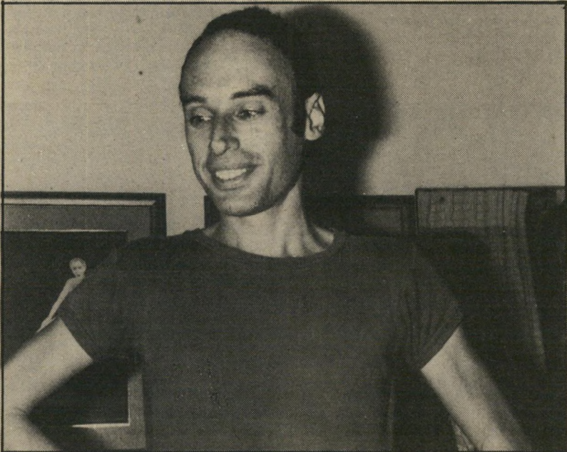
חנוך לוין מטופל בידיה של המטפלת

אם חשבתם שפירסום הסיפור על המחזאי חנוך לוין והמטפלת הגרמניה ישבור אותו, והוא יחזור מלונדון הביתה אל אשתו ואל ילדיו, הרי טעיתם טעות גסה. חנוך לוין נמצא עדיין בלונדון, מטופל היטב בידיה של המטפלת, והשבוע הוא הודיע לכל המתעניינים שלפחות במשך שלושה חודשים הוא לא חוזר. אבל מיודעיו ידעו שאחרי שלושה חודשים לא תהיה לו ברירה, כי הוא חתום על חוזה עם התיאטרון הקאמרי, שבו הוא מתחייב לכתוב להם כל שנה מחזה חדש, וגם לביים אותו. וכשביל לביים, כידוע, אדם צריך להיות נוכח.