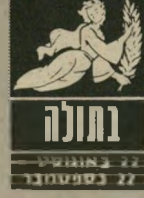
22 באוגוסט - 22 בספטמבר

ענייני כספים מעסיקים אתכם רבות בימים אלה, לא טוב לתת לאחרים לארגן עבורכם את החשבונות. לא מפני שאי-אפשר להאמין ל"הם, אלא שאתם מאב"דים את השליטה ונכנ"סים לתיסבוכת שממנה יהיה קשה לצאת. בת"קופה זו אתם נוטים להיות יותר עצבניים מ"תמיד, ואין סבלנות לע"סוק בעניינים שברדך"כלל אינם מכבידים ע"ליכם. ובכל זאת, דווקא עכשיו אין אפשרות להשתחרר מלקחת על עצמכם את האחריות.