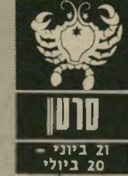
21 ביוני - 20 ביולי

גם אם תיכננתם לבלות בחיק הטבע או בכל מקום מרוחק מעט מהבית, נראה שלא יהיה קל לבצע זאת. משום מה תצטרכו להישאר ב"בית בגלל בעיה של אחד מבני המישפחה. אם ב"כל זאת תצליחו לצאת. קרוב לוודאי שיתלוו אליכם אנשים שחבר"תם אינה קלה. והם יגר"מו לעבודה ולא יאפשרו לכם למצוא זמן למנו"ח. עד ה"20 בחודש השגיתו מאד על הבריאות אתם נוטים לסבול מבעיות שנובעות מעודף מאמץ.