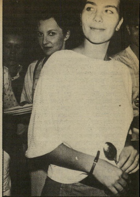
כלה טלי צמח איפה להקת הנח"ל?

כשעל ראשה כובע ורוד מצופה בשובל חרוזים, היווד עד כתפה. ברכה מברכת את המוזמנים בחמש שפות (לא כולל עברית) והתיזמורת עושה כומים במקום המתאים. כשיורדת אם הכלה, זרקור-ענק זורק אור על מסך גדול, ועליו תמונות מחיי היומיום של הווג הצעיר. הווג הצעיר יושב בבית-קפה, הווג הצעיר אוכל גלידה, הווג הצעיר מטייל יד ביד, הווג הצעיר מסתכל בשקיעה, הווג הצעיר מורד בגדים לחתונה, הווג הצעיר מחייד, וכך הלאה. וכל המופע האור-קולי הזה הוביל לרגע של החופה. מתחת לחופה עמדו הורי הכלה והורי